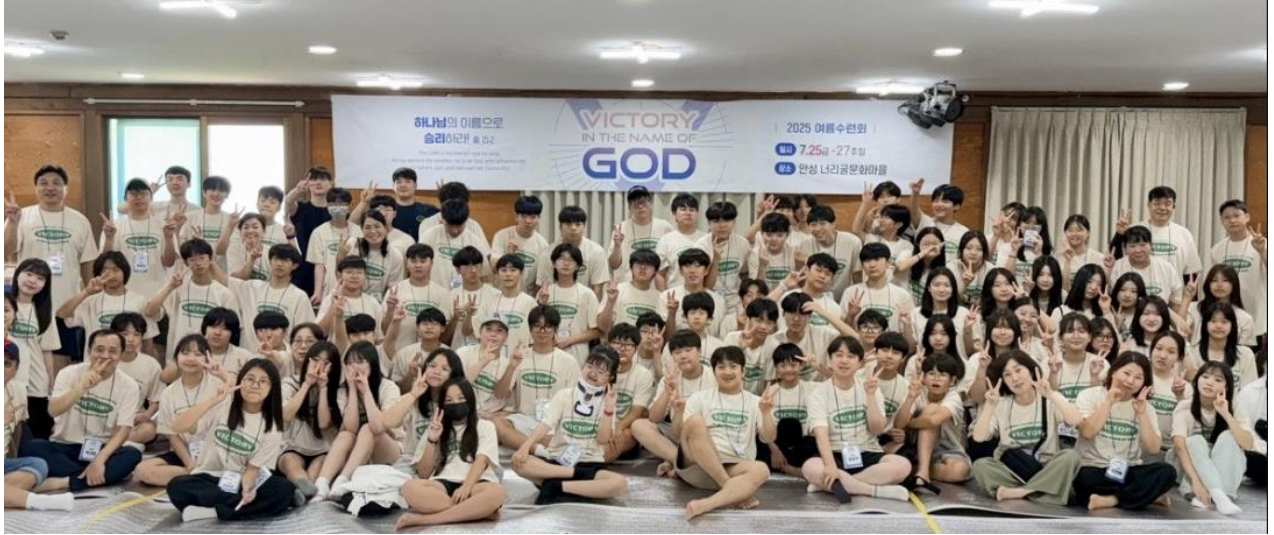
#3: 겨울성경학교, 여름성경학교